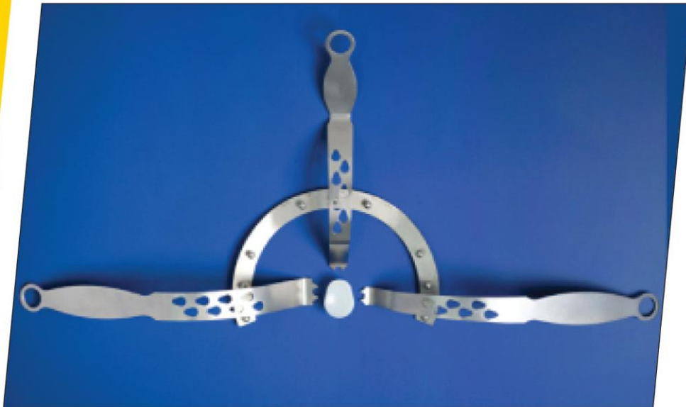
Matériel développé en collaboration avec le Professeur Philippe Hardy